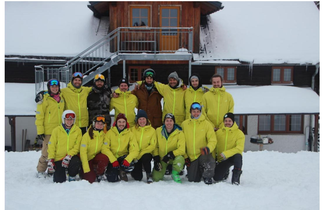
Ein Teil unseres Lehrteams (Bild von 2019)

Informationen zu allen Veranstaltungen der Skischule gibt es auf der Website!